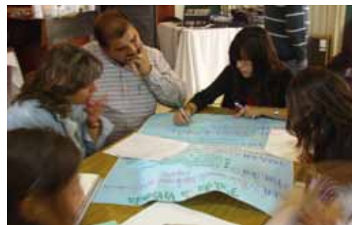
Taller en la provincia de Neuquén

fue mejorando en calidad a medida que transcurrían los talleres y que el equipo iba incorporando aprendizajes a partir de la práctica y produciendo adaptaciones que permitieron refinar progresivamente tanto los contenidos como las dinámicas pedagógicas de las actividades. Los talleres lograron mantener una saludable diversidad de acentos, atendiendo a los matices que imponían los intereses de los participantes de cada uno, pero apuntando a una complementariedad entre la cuestión de los derechos civiles y políticos a partir de la memoria histórica de la dictadura y la problemática de los derechos económicos, sociales y culturales, así como de los llamados derechos emergentes. Además de las muy satisfactorias evaluaciones de las casi 500 personas