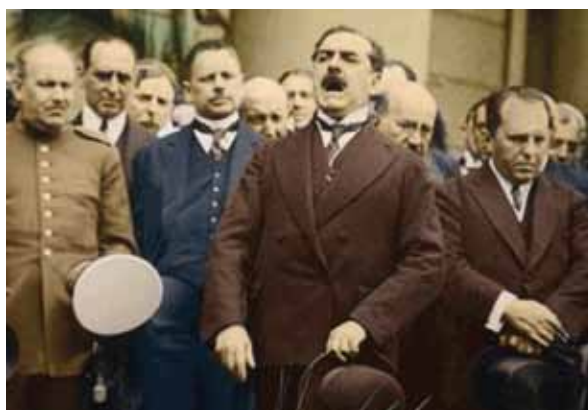
Manuel Carlés, "Liga Patriótica", 1919

Se llevó adelante en la Universidad el IV Taller de discusión sobre "Las Derechas en el Cono Sur, siglo XX", organizado por el Instituto del Desarrollo Humano. Durante el taller pudieron oírse las exposiciones de especialistas de la UNGS, la Universidad Estadual Paulista, la UNCu (Cuyo), la UNLP (La Plata), la UNCPBA (Centro) y la UBA (Buenos Aires) así como de organismos públicos de promoción de la investigación científica, como el CEIL-PIETTE (CONICET). El encuentro se desarrolló bajo tres ejes temáticos: "Círculos y circulación", "Formas y formación de las derechas" y "Las derechas en la Argentina peronista". Las presentaciones fueron múltiples y diversas, tanto en relación con las problemáticas que abordaron como respecto a los actores