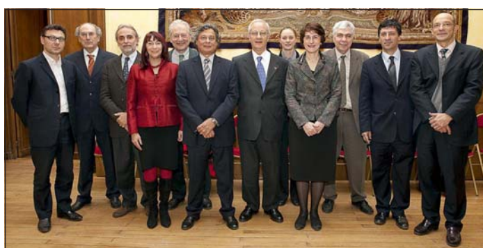
Participantes del acto de firma del convenio con la Université Paris 3.

L os días 15 y 16 de febrero, los rectores de las universidades nacionales de Quilmes y de General Sarmiento realizaron fructíferas reuniones con autoridades de las universidades francesas con las que se comparte la iniciativa de creación de la "Cátedra Juan Bautista Alberdi", y firmaron acuerdos marco de cooperación con la Université Paris 3 -