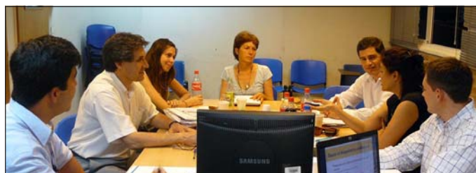
Representantes empresarios junto al equipo de la UNGS.

En el marco del servicio no rentado “Asistencia técnica a instituciones de apoyo empresario y fomento comercial para el fortalecimiento de sus capacidades institucionales”, que el Instituto de Industria desarrolla desde 2009, el 11 de marzo a las 18 se realizará la segunda mesa de debate con dirigentes de importantes cámaras empresariales y especialistas