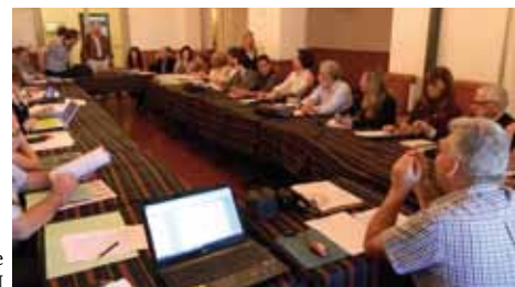
Reunión de la Comisión de Ciencia y Técnica del CIN

se enfatiza la importancia de comenzar a valorar los proyectos orientados a la resolución de problemas de la sociedad, superando los estrechos criterios bibliométricos para evaluar la actividad de investigación, e incluyendo en esta evaluación a los “no pares”, principalmente a los destinatarios directos.