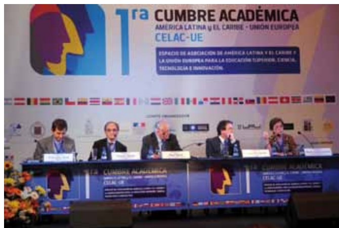
Un momento de las deliberaciones en Santiago.