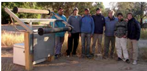
Productores caprinos junto a la heladera solar

Del proyecto, además del equipo de la UNGS, participan el IPAF pampeano del INTA, el INTI, APENOC y las escuelas agrarias de la zona. Esta metodología de trabajo presenta múltiples ventajas, teniendo en cuenta la diversidad de actores que se fueron sumando, su nivel de articulación y su compromiso con el proyecto. Lo más importante no es la finalización de la primera etapa, sino la profundización de un proceso de relaciones que promueve la capacidad de, por un lado, generar desarrollo local y apropiarse del conocimiento