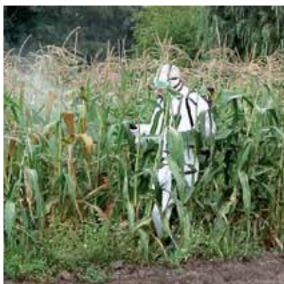
Fumigación con traje protector