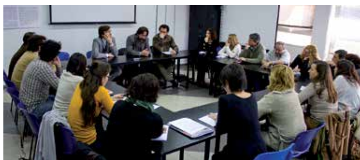
El equipo de trabajo en la UNGS