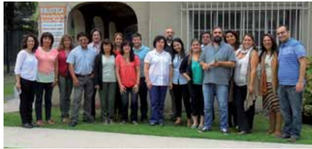
Participantes del taller de tiftotecnologías en el Campus

Respecto a este último punto, el ASD preparó y desarrolló el curso de formación continua “Aplicaciones de tecnologías adaptativas para la discapacidad”, aprobado por resolución del rector, que ha permitido ofrecer capacitaciones a distintos organismos nacionales y provinciales, con el fin de replicar la experiencia de la UNGS en la producción de textos accesibles y en la forma en