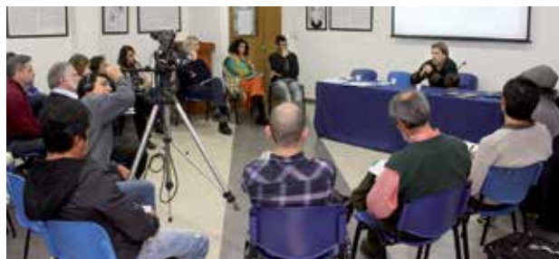
Un momento del encuentro en la UNGS

Las investigaciones permiten inferir que en el contexto concreto de estos partidos el problema que se observa tiene menos que ver con carencias de recursos que con cierta sub-utilización de los mismos: de los espacios públicos, de los equipamientos (adquiridos o recibidos en el marco de políticas públicas), de los servicios (gratuitos o contratados), de la oferta cultural local, y también, en el caso de las webs municipales, del ciberespacio.