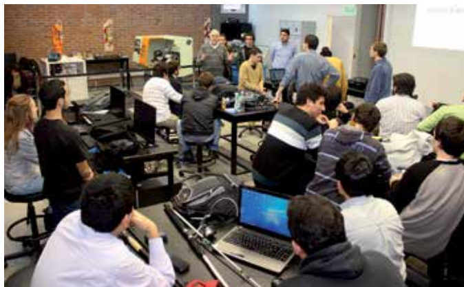
Laboratorio de Ingeniería

Entre las valoraciones positivas, los evaluadores destacan que “la carrera cuenta con un plan de desarrollo, con metas a corto, mediano y largo plazo, para asegurar el mantenimiento y mejora de la calidad académica para cada una de las dimensiones de análisis, para el período 2012-2015”. Se enfatiza que el plan de estudios 2012 “delineó una nueva currícula con una carga horaria total inferior, en la que se redujo no sólo la cantidad de materias, sino también la cantidad de semanas de clase por