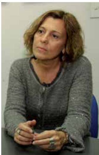
Entrevista de El aire de la Uni , (lun a vier, de 9 a 12).

planchar las cosas, como sucede hoy en muchas provincias, donde los archivos de la memoria no tienen presupuesto. Es importante que tomemos conciencia y también que asumamos que es responsabilidad de toda la sociedad seguir avanzando en juzgar a los responsables de los crímenes de la dictadura; en encontrar a las víctimas, en sanar heridas; en reconstruir los lazos que se perdieron; en que las FF. AA. se reintegren definitivamente a la sociedad.