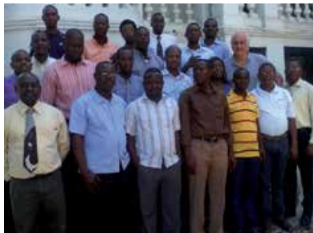
El autor con un grupo de estudiantes.