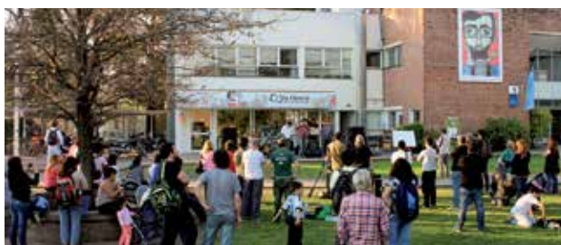
Uno de los momentos del festejo, con "Nuestro crimen".

Hubo también distintos eventos, como el "Festival Dub" con la conducción del DJ Selektor de Con-