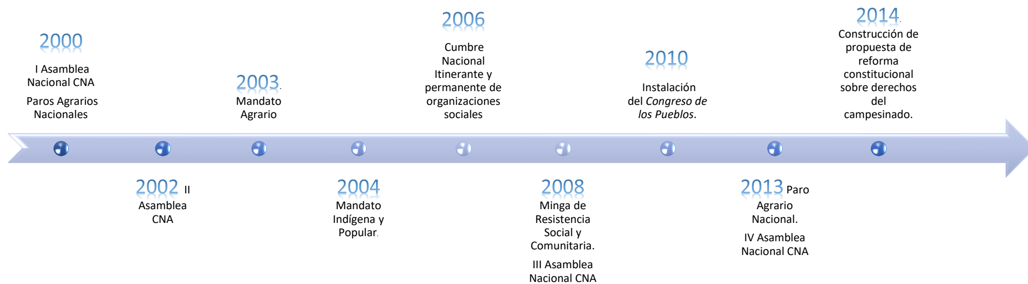
Ilustración 2 Principales hitos de la acción colectiva del campesinado/Coordinador Nacional Agrario