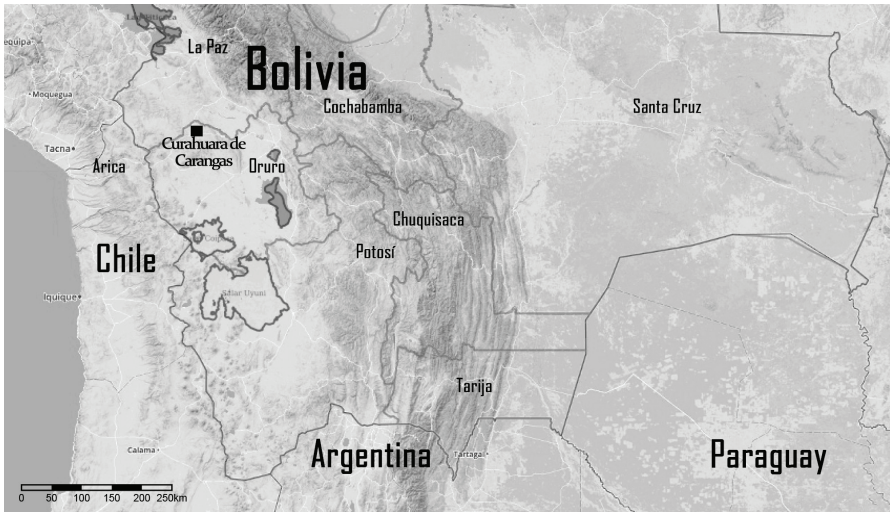
Mapa 1: Ubicación de Curahuara de Carangas, Oruro, Bolivia