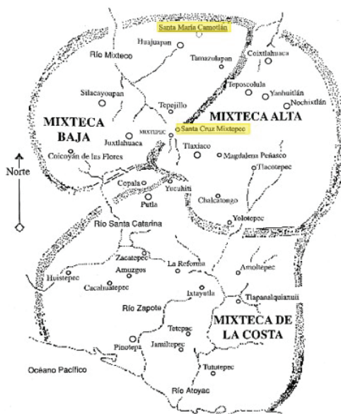
Mapa 2: Mixtecas Baja y Alta